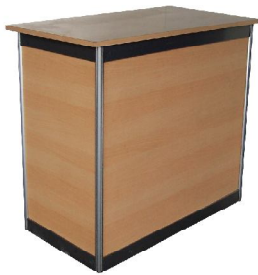
MOSTRADOR P.V.P: 90€