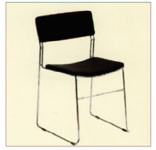
ASTI P.V.P: 14,75€