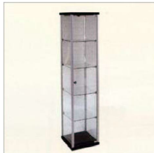
VITRINA CANALE P.V.P: 175 €