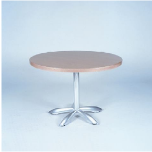
BARCELONA P.V.P: 31,00€