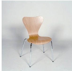
OLIMPIA P.V.P: 27€