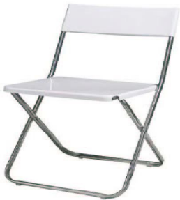
BIBE (B/N) P.V.P: 10€