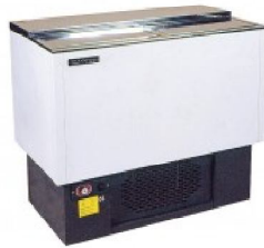
ARCON BOTELLERO P.V.P: 175,25€