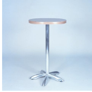
BARCELONA ALTA P.V.P: 33€