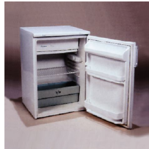
FRIGO PEQUEÑO P.V.P: 65,48€