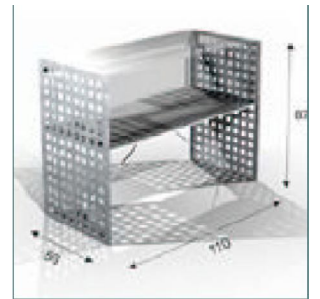
MOST. METALICO P.V.P: 165,75 €