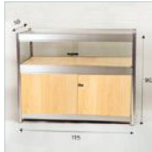
MOST. VITRINA P.V.P: 150 €