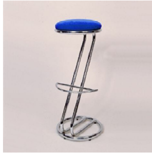
ZEUS (colores) P.V.P: 23€