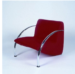
PENNY P.V.P: 54€