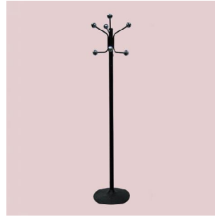
PERCHERO PIE P.V.P: 28,85€