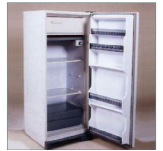
FRIGO GRANDE P.V.P: 102,75€