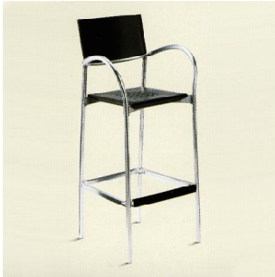
RIESI P.V.P: 37€