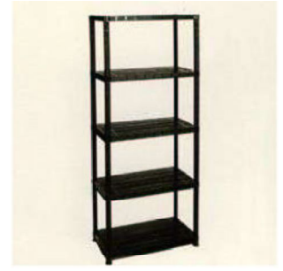
EST. RESINA P.V.P: 28€