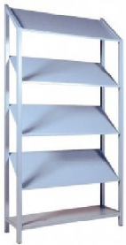
EST. INCLINADA P.V.P: 34,75€